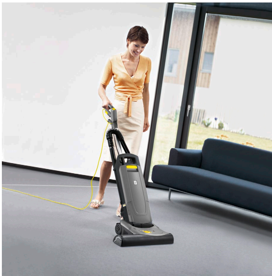
CV 48/2 Adv